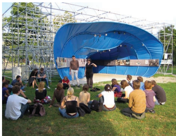
Seminarium „Kultura pamięci XX wieku w Polsce i w Niemczech”