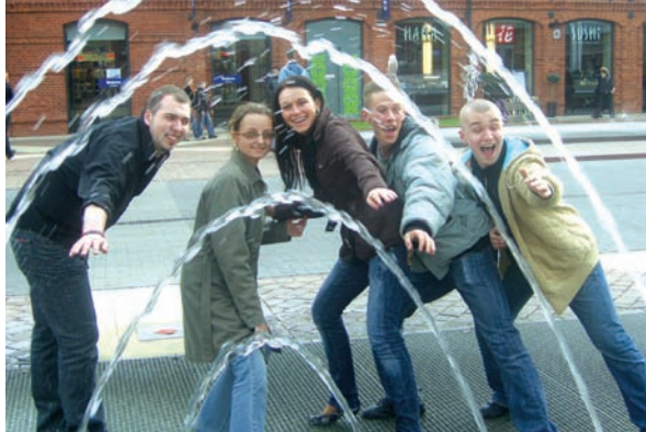
Społeczeństwo informacyjne. Wymiana doświadczeń i prezentacja dobrych praktyk jako element budowy europejskiego społeczeństwa informacyjnego – polsko-niemieckie seminarium adresowane do studentów szkół administracji publicznej