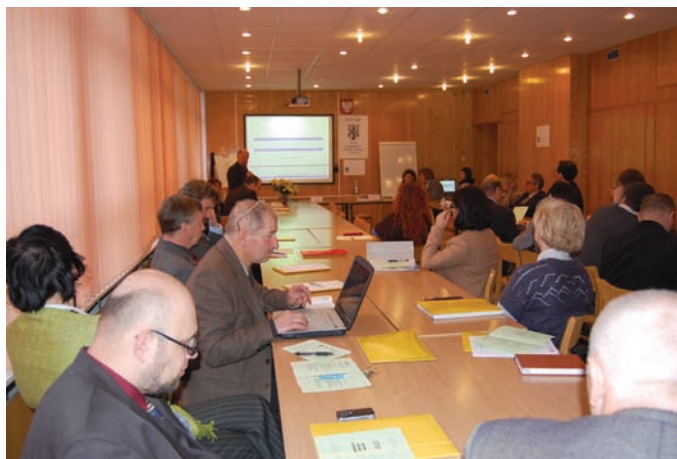
Międzynarodowa konferencja naukowa z cyklu Colloquium Opole: „Otwarta Europa – otwarte regiony – nowy wymiar migracji”