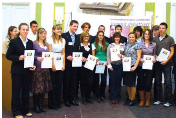
Uczestnicy II Międzynarodowego Finału Konkursu „Młodzież prowadzi międzynarodowe debaty” w Warszawie