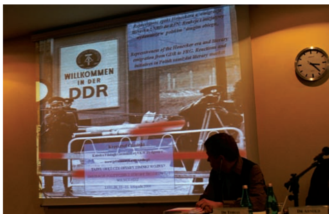
Międzynarodowa konferencja naukowa „Tajny oręż czy ofiary zimnej wojny? Emigracje polityczne z Europy Środkowej i Wschodniej”