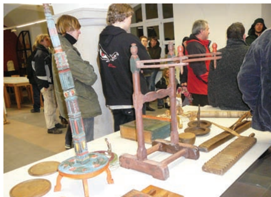
Seminarium młodzieżowe „Dolny Śląsk – wspólne dziedzictwo kulturowe Polaków, Niemców i Czechów”