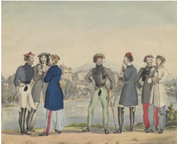
Würzburger Studenten (um 1820)