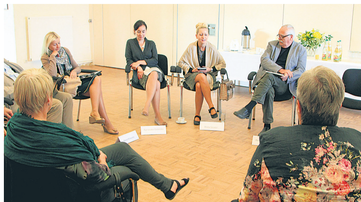
Opowiadanie biografii w Gut Gödelitz